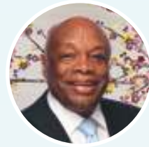
董事會顧問 Honorable Willie L. Brown, Jr.