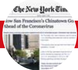
The New York Times