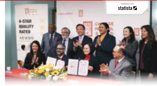
UCSF Health 與東華醫院簽署合作協議

取得專業護理機構牌照；加州眾議員丁右立再次成功為東華醫院爭取 500 萬美元州政府撥款；與 UCSF Health 達成長期合作協議，以更有效地擴展服務範圍。這些成就推動醫院繼續發展，擴大專科服務範圍，並致力滿足不同文化背景病人的醫療需求，以縮小健康差異。