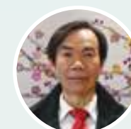
陸潮基 三邑總會館